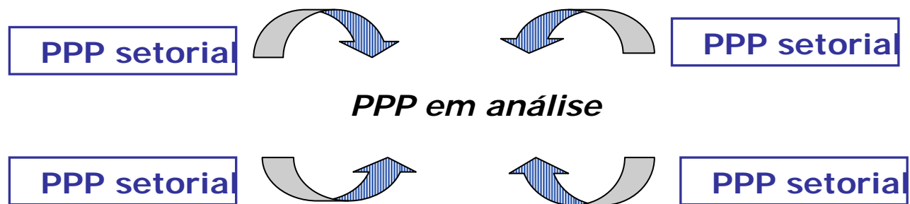
Figura 2 - A AAE de uma política, plano ou programa deve levar em conta sua compatibilidade com outras políticas, planos e programas.

Por outro lado, a AAE possibilitaria também a análise da compatibilidade do PPP em questão com outros PPPs governamentais (articulação horizontal), conforme esquematizado na Figura 2 . Desta forma, um plano de transportes, por exemplo, deveria ter verificada sua compatibilidade com planos de uso dos solos, de recursos hídricos, de energia e de proteção da biodiversidade, entre outros. Também aqui há inúmeras dificuldades práticas, destacando-se: (i) planos e programas setoriais poucas vezes são formulados de modo claro e sem contradições internas; e (ii) os planos já existentes (e que serão supostamente levados em conta na AAE) podem já não ser compatíveis entre si.